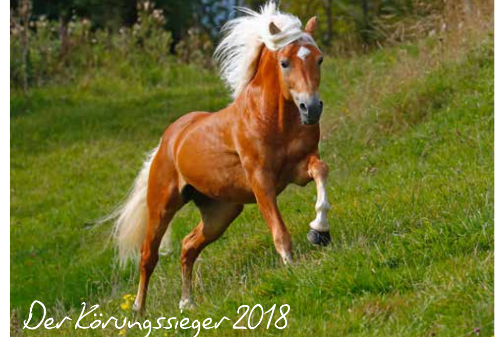
Der Körungssieger 2018